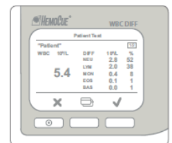
3 Visualice los resultados.